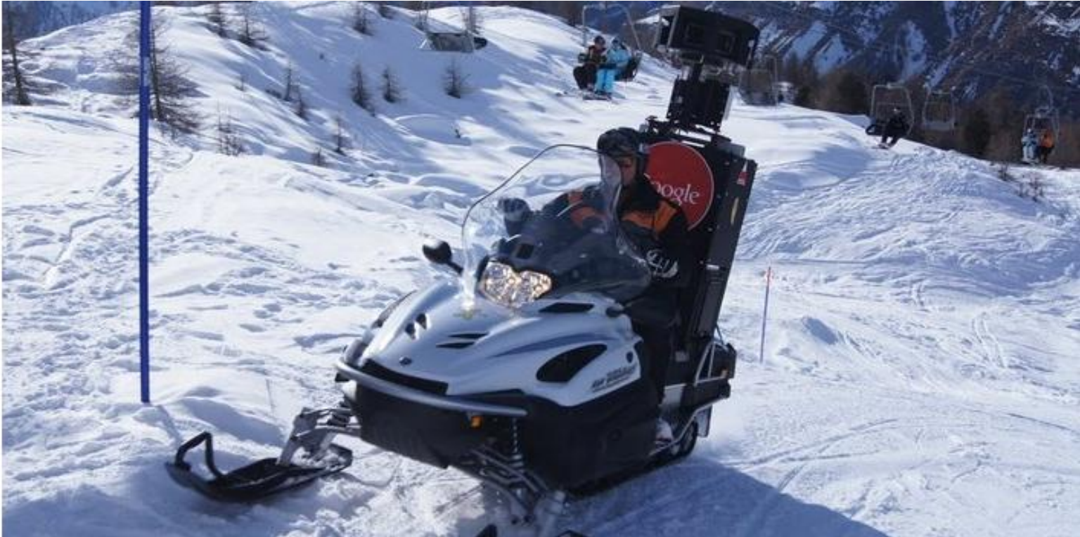
Google-snøskuteren er på plass i Holmekollen.